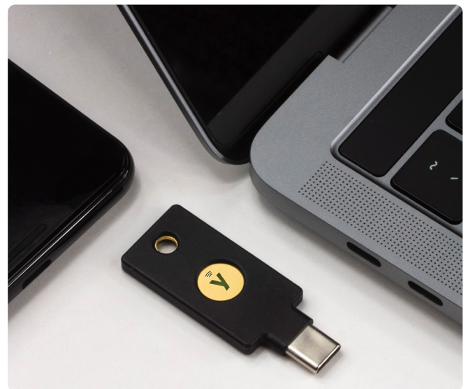
Les clés YubiKey offrent une authentification utilisateur forte sur l'ensemble des plateformes et des appareils

Yubico est l'inventeur principal des standards d'authentification WebAuthn/FIDO2 et Fido U2F adoptées par la FIDO Alliance, et la première entreprise à produire la clé de sécurité U2F et un authentificateur multi-protocoles FIDO2.