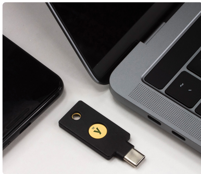
Las YubiKeys envían una autenticación de usuario sólida en todas las plataformas y dispositivos

Yubico es el principal inventor de los estándares de autenticación WebAuthn/FIDO2 y Fido U2F adoptados por FIDO Alliance y es la primera empresa en producir la llave de seguridad U2F y un autenticador FIDO2 multiprotocolo.